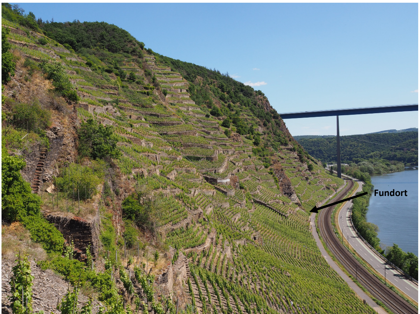
Abbildung 5 Gesamtlebensraum der Karst-Mauerbiene im von Terrassenweinbau geprägten Winninger Uhlen (Unteres Moseltal). Im Hintergrund ist vor der Moseltalbrücke die Blumslay als ausgedehnte Felslandschaft zu sehen, vor der der Nachweis von Osmia labialis erfolgte.

Unser Nachweis der Karst-Mauerbiene vom 06.07.2022 am Spitznack stellt einen Wiederfund der Art für Rheinland-Pfalz dar. Der einzige zuvor bekannte Fund ist knapp 83 Jahre älter und stammt vom 10.08.1939 aus Leistadt (Bad Dürkheim). Dort konnte die Art trotz gezielter Nachsuche nicht mehr festgestellt werden. Im Naturraum Mittelrheingebiet ist O. labialis als bodenständig einzu-