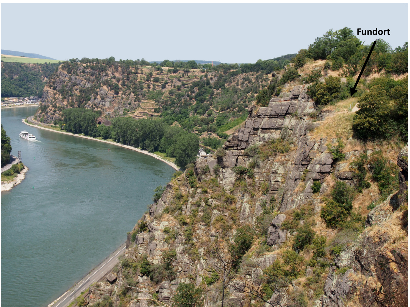
Abbildung 3 Blick auf die markanten Felsformationen des Spitznack-Felsens bei Bornich (Oberes Mittelrheintal), wo der Wiederfund von Osmia labialis in Rheinland-Pfalz erfolgte. Links im Hintergrund ist die Loreley zu sehen.

Der hessische Fundort liegt ebenfalls im Oberen Mittelrheintal (Bacharacher Tal) am Südwesthang der Ruine Nollig, westlich der Stadt Lorch und damit am äußersten Rand von Hessen. Das dortige Gebiet zeichnet sich durch vegetationsarme Schieferschutthalden und Felsrinnen sowie aufgelassene Weinberge mit Felsflurgesellschaften aus, die durch Biotoppflege offen gehalten werden. Der Nachweis der Karst-Mauerbiene erfolgte vermutlich an einer dortigen Felskuppe oder dem darunter liegenden Geröll. Centaurea scabiosa ist am Standort häufig (TISCHENDORF, pers. Mitt.). Der Fundort wurde von TISCHENDORF & FROMMER (2004) über mehrere Jahre intensiv auf seine Stechimmenfauna untersucht. Bei den Untersuchungen gelangen bemerkenswerte Nachweise verschiedener wärmeliebender Arten, bspw. Hoplitis mitis (NYLANDER, 1852), M. lagopoda oder Eumenes