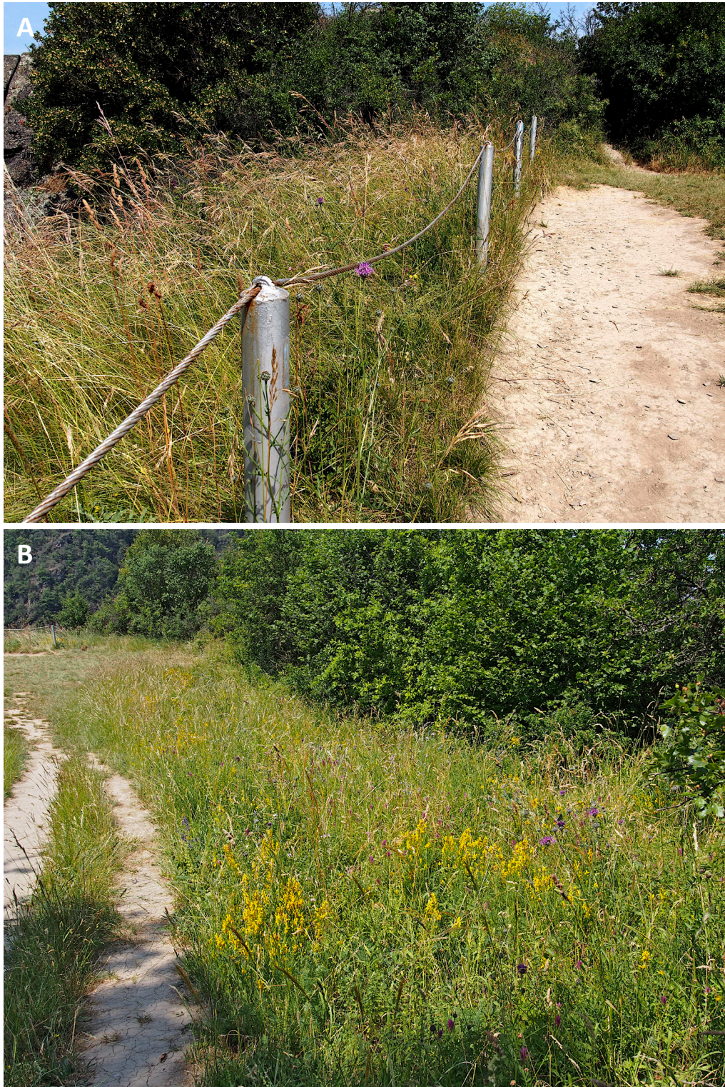
Abbildung 4 Fundorte von Osmia labialis am Spitznack-Felsen, bei Bornich (Rheinland-Pfalz). Durch die im Aufnahmejahr 2023 stark wüchsigen Gräser ist die Pollenpflanze Centaurea scabiosa auf den Bildern nur stellenweise sichtbar. Syntop flogen hier u.a. Megachile lagopoda und Rophites algius .

subpomiformis BLÜTHGEN, 1938. Für weitere Beschreibungen und Bilder des Fundorts sei auf TISCHENDORF & FROMMER (2004) verwiesen.